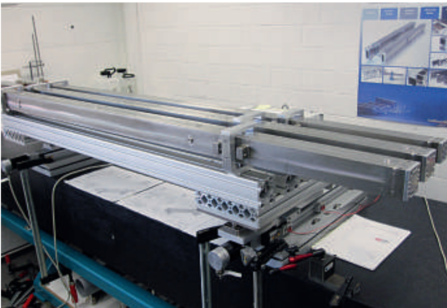
Translationssystem mit zwei XE-Spindelachsen zur präzisen Positionierung von Neutronenleitern. Die Stahlbehälter sind Vakuumgehäuse, in denen sich die Neutronenleiter aus Glas befinden

Die Installation von Neutronenoptiken erfordert höchste Präzision. Für die Positionierung und Ausrichtung ist eine Genauigkeit im Bereich von Hundertstel Millimetern und Grad gefordert. Diese Genauigkeit wird durch Präzisionsmechanik erzielt.