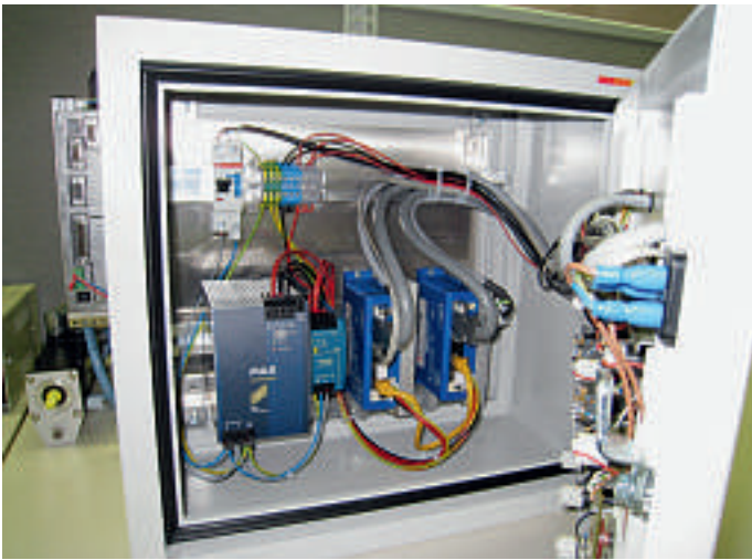
Parkem entwickelte eine Testbox, die den Funktionstest der Applikation erlaubt und den Genauigkeitsnachweis für den Kunden liefert