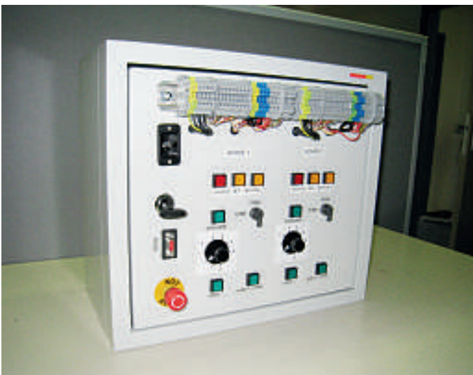
Die Verdrahtung von Motor- und Geberanschluss der Testbox erfolgt über elektrische Klemmen an der Türaussenseite

Die Spindelachsen der HD-Serie wurden speziell für robuste und genaue Positionierlösungen entwickelt. Bedienung, Installation und Wartung gestalten sich einfach. Die robuste Bauweise umfasst ein stranggepresstes Profil und einen Läufer, welche sich durch besondere Biegefestigkeit und Läufersteifigkeit auszeichnen. Die Linear- und Kugellager sind selbstschmierende Präzisionskomponenten mit langer Lebensdauer, selbst bei Vollauslastung. Ausserdem verfügt die HD-Serie über Riemenabdeckungen in Schutzklasse IP 30, welche die inneren Komponenten vor Verunreinigungen schützen.